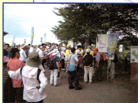
②元冢 (利根川の主要支川で約1万 haの農地を潤している。)