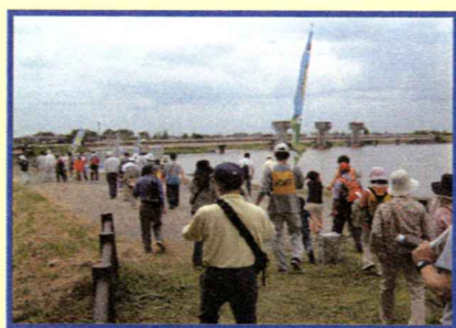
③福岡堰 (全国の疏水百選に選ばれた。 春に桜の名所としても有名。)

スタート・福岡堰さくら公園~元冢・水門~福岡堰 ~伊奈神社~ゴール・福岡堰さくら公園