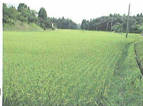
未来への財産 田園風景