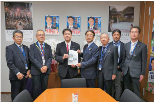
進藤金日子参議院議員