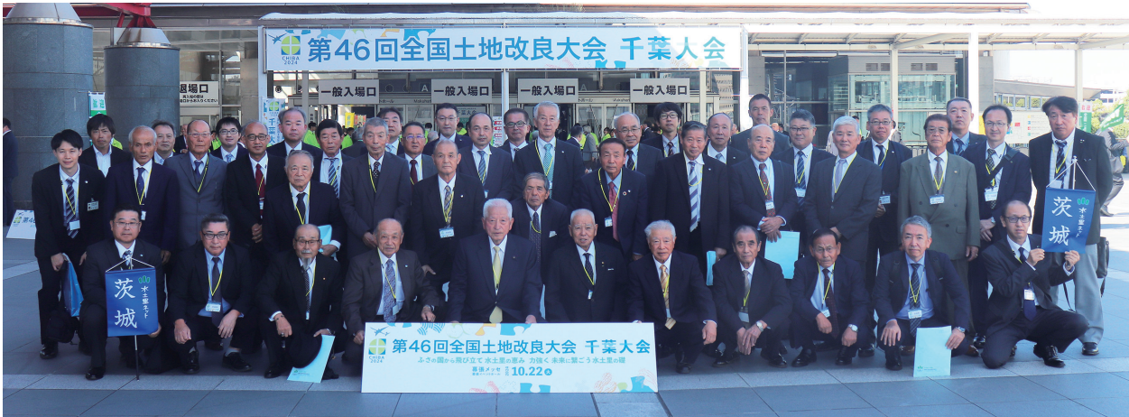
幕張メッセイベントホール前にて

去る令和6年10月22日（火）、千葉県千葉市「幕張メッセイベントホール」において、第46回全国土地改良大会千葉大会が、「ふさの国から飛び立て水土里の恵み 力強く未来に繋ごう水土里の礎」をテーマに開催され、全国の土地改良関係者約4,000人が参加し、農業を支える農地と水を守り育む、土地改良の役割を再確認するとともに、農業と農村の重要性と、それを支える整備事業の役割を広くアピールする目的で開催され、今回で46回目となった。