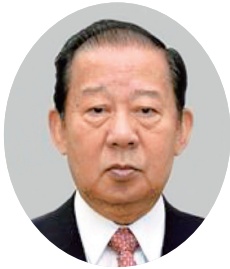
全国土地改良 事業団体連合会