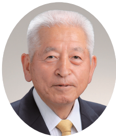
茨城県土地改良 事業団体連合会