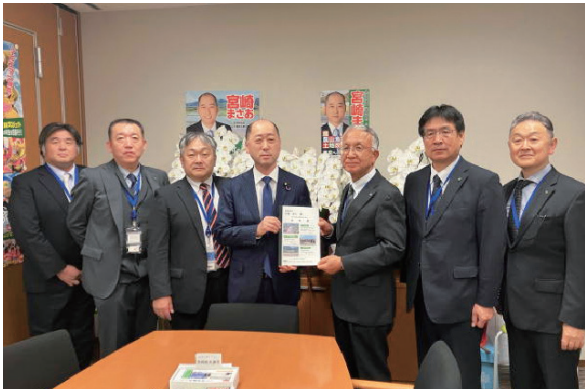
宮崎雅夫参議院議員