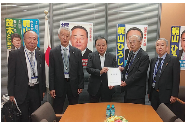
梶山弘志衆議院議員への要請