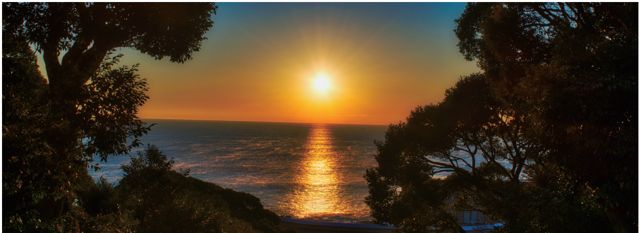
大洗磯前神社から望む日の出